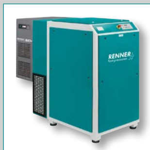
RSK 18,5 – 45,0