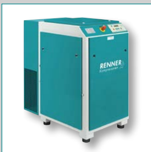
RS 18,5 – 75,0