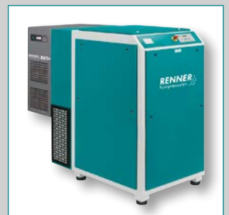
RSKF 18,5 – 45,0