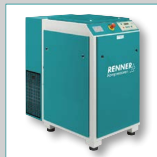
RSF 18,5 – 75,0